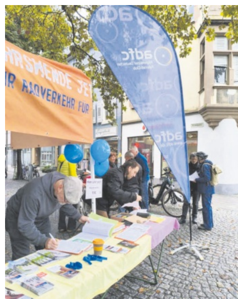
Bild der letztjährigen Veranstaltung vom 27.09.2025 in Lahr