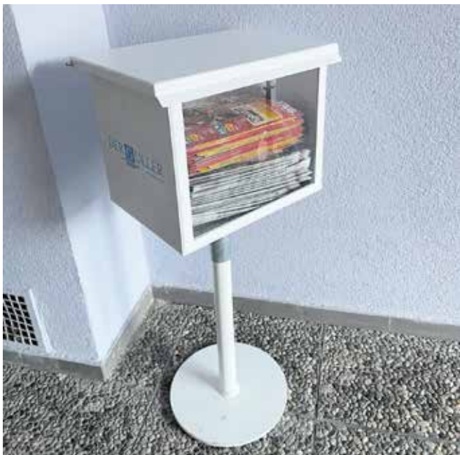
Mailbox "Der Guller" beim Evang. KiWy Kindergarten

Eine Mailbox "Der Guller" steht bei dem Eingang des Evang. KiWy Kindergarten in der Lindenstraße 5. Hintergrund ist der Wunsch von Bürgerinnen und Bürgern an den Vertrieb STAZ und GULLER, welche eine flexiblere und unabhängige Zugriffsmöglichkeit auf die aktuelle Ausgabe wünschen. Sollten Sie kein GULLER erhalten haben, dürfen sie sich gerne an der Mailbox bedienen.