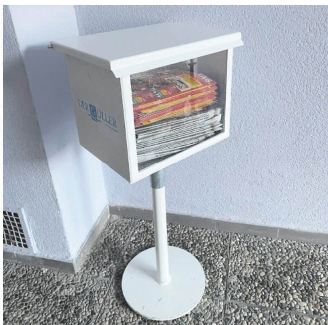
Mailbox "Der Guller" beim Evang. KiWy Kindergarten

Eine Mailbox "Der Guller" steht bei dem Eingang des Evang. KiWy Kindergarten in der Lindenstraße 5. Hintergrund ist der Wunsch von Bürgerinnen und Bürgern an den Vertrieb STAZ und GULLER, welche eine flexiblere und unabhängige Zugriffsmöglichkeit auf die aktuelle Ausgabe wünschen. Sollten Sie kein GULLER erhalten haben, dürfen sie sich gerne an der Mailbox bedienen.