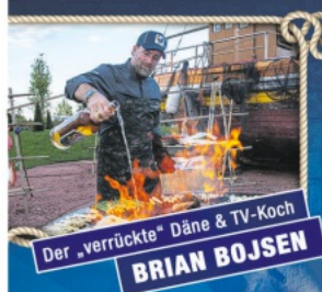
Der „verrückte“ Däne & TV-Koch BRIAN BOJSEN