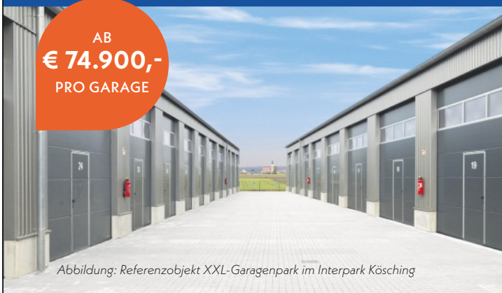
Abbildung: Referenzobjekt XXL-Garagenpark im Interpark Kösching