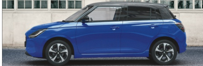
Abbildung zeigt aufpreispflichtige Sonderausstattung. Mehr Informationen zu Ausstattungslinie und Sonderausstattungen finden Sie hier: