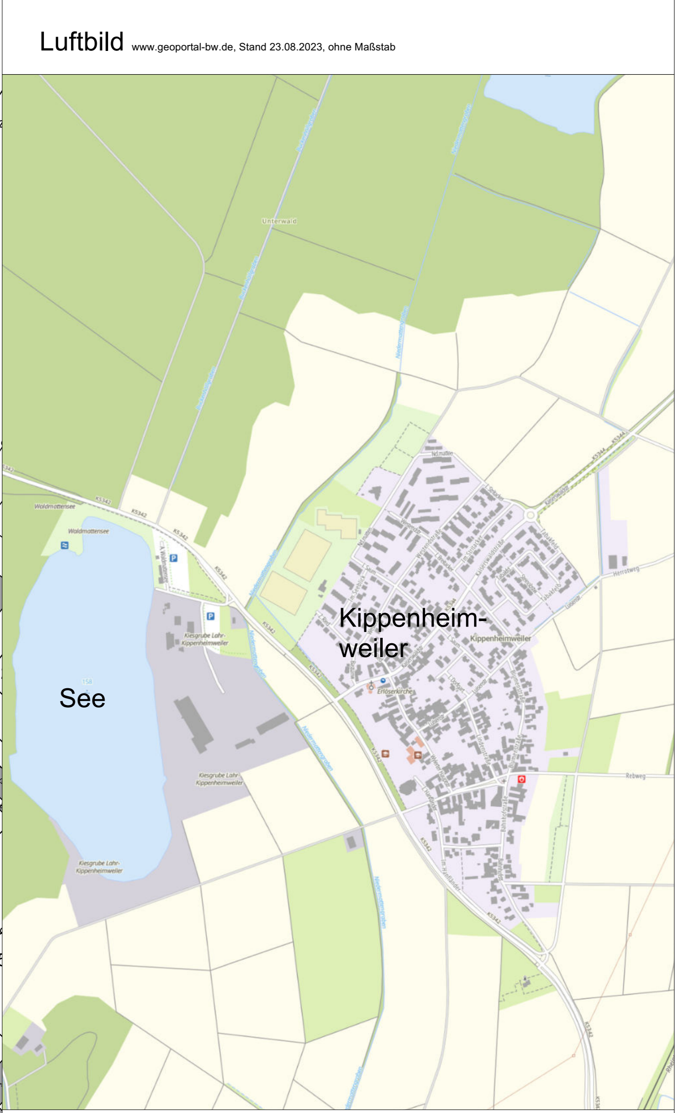
Übersichtskarte www.geoportal.bw.de, Stand 23.08.2023, ohne Maßstab