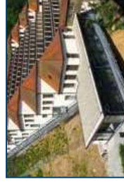
Terrassenbau Junghans Schramberg | 1916-18