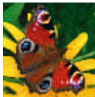
Paon du jour