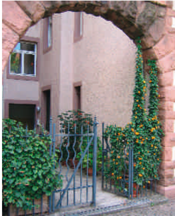
Hortensia grimpant et Suzanne aux yeux noirs