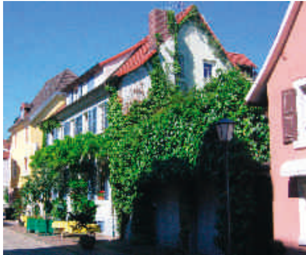
Façades à la Schlosserstraße avec des plantes en pots, des glycines et du lierre

C'est précisément dans le centre dense de la ville, où apparemment il y a peu de place pour de grandes plantations qu'il est réalisable d'aménager des espaces verts sur des façades de maison. Une " fourrure verte " pour un mur ou un bâtiment peut aussi créer un espace vital pour les plantes et les animaux.