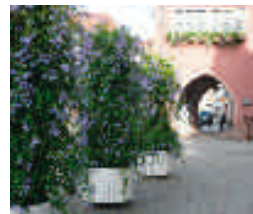
Espaces verts à la Rosenbrunnen (à gauche) et à la Urteilsplatz (à droite)